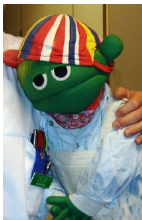
Alkohol & Narkotika 2/2019.

—Är det inte dags att ta fram Gerhard Larssons utredning och se vilka av förslagen som är realiserbara?